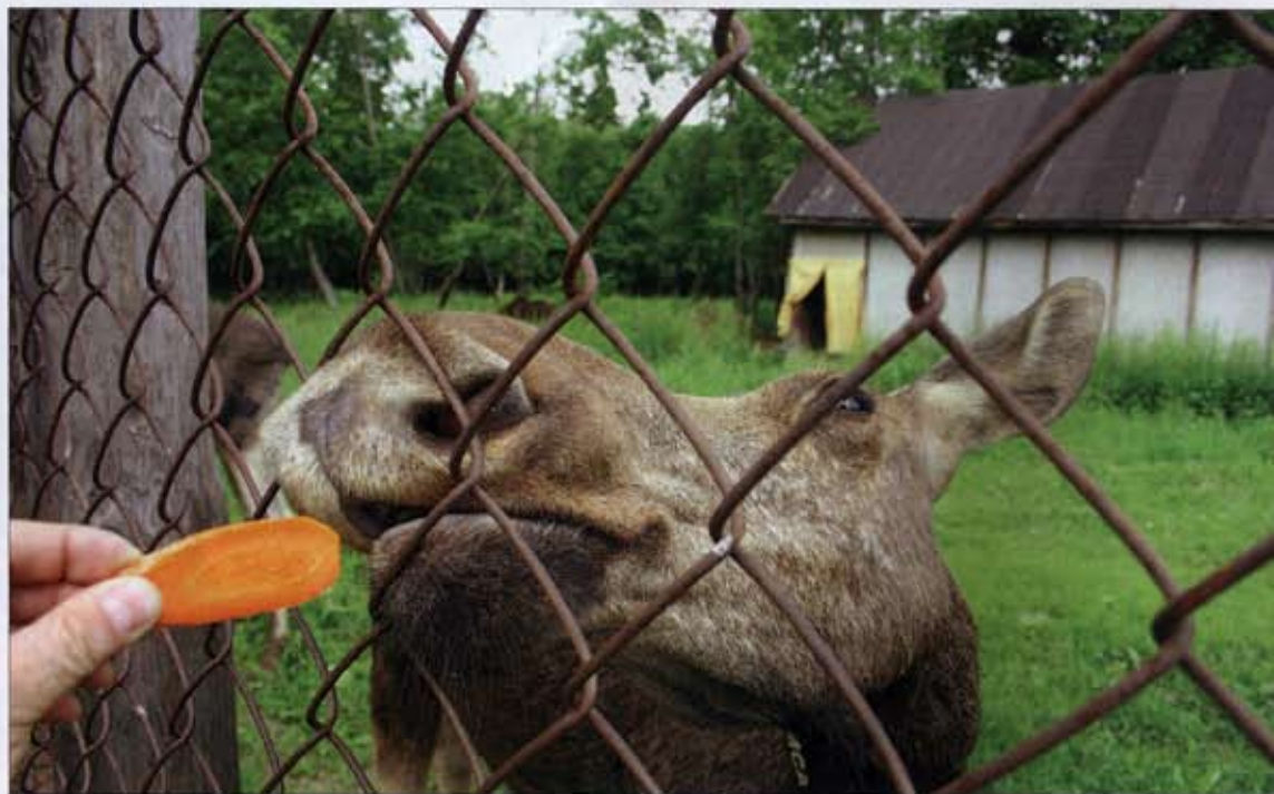
Уберите морковь: я сижу на Монтиньяке

Дальше мы отправились на лосиную ферму. Я даже не представлял, что это такое. Нас встретила большая женщина в черных резиновых сапогах. Она дала попробовать лосиного молока. Было противно. Но, оказывается, это молоко поступает в санаторий и помогает от разных болезней. Каких, я так и не разобрался. Женщина оказалась студенткой из Ярославля на практике. Она дико смущалась, краснела, и поэтому у нее всегда был такой приятный румянец. Маленькие лоси бежали к ней, похоже, они видели в ней свою маму. Оправившись от смущения, она рассказала нам, что эту ферму придумал какой-то иностранец, а мы все поддерживаем его начинание. Он всю свою жизнь посвятил лосям. Я представил себе этого человека. Где-то на севере, а может быть, на юге живет старенький профессор и думает о лосях из-под Костромы. Удивительно. Так же англичане-архитекторы думают о старых памятниках Москвы и пытаются защитить их. Возможно, у нас есть шанс. Такая красивая страна. Если все будут о нас думать, может быть, все будет в порядке? Мы кормили лосей и, по-моему, получили от этого большее удовольствие, чем наши дети. Это просто супер-место для экотуризма. Такой лес, и так спокойно.