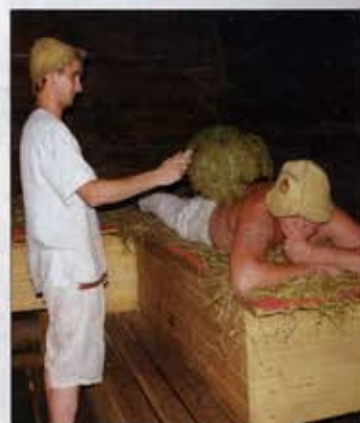
Ах, русская ты баня, Ах, прогони печаль