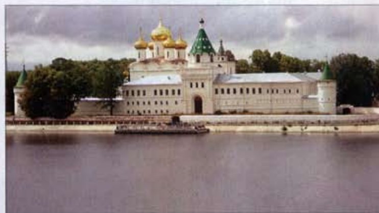
Волга-Волга, мать родная...

так я бы охарактеризовал эти пейзажи. Люблю ли я эти картины? С грустью приходится признать, что не особо. Покосившиеся домики с треугольными крышами, печальные старушки с брусничкой и лисичками. Странного вида придорожные кафе с названиями типа «Во дворце», «У дяди Ашота», «Павлинь» и бесконечные строительные рынки, в очередной раз подчеркивающие созидательный бум в нашей стране. Я вспоминал свою поездку в конце 70-х, когда мы с родителями, дядей, тетей и сестрой на двух машинах путешествовали по Золотому кольцу. Это было чудесно. Несмотря на то, что гостиниц было мало и мы ночевали как придется. Половина церквей была в ужасном состоянии: в некоторых находились склады или выгрезвители. Все равно было очень весело, потому что во время поездки как-то все становится проще.