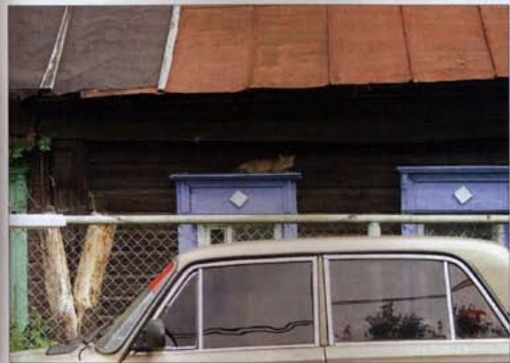
День. Улица. Машина. Кошка

щение, что жизнь из Костромы немножко ушла. Как будто все заснуло. Дороги, как всегда, неряшливые, медленно скатываются к берегу Волги. Берега зарастают бурьяном, но вид на реку потрясающий. Было тепло, и многие купались. Громадная река делит город на две части. Десять лет назад я был в Ливерпуле. Город — некогда величайший порт колониальной Британии — тоже показался мне скучным и спящим. Везде Ливерпуль